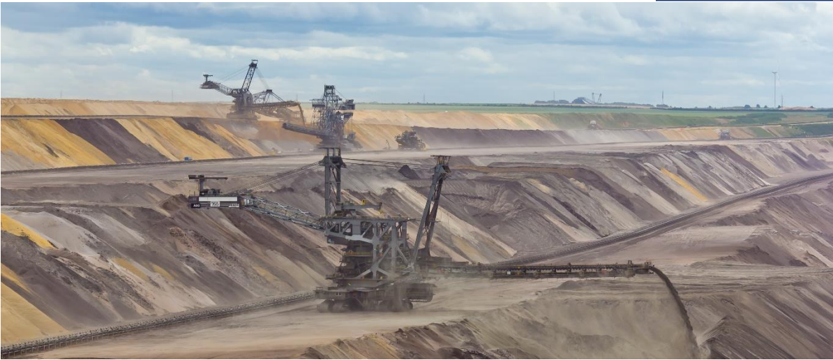
FACTSHEET (10/2021) IM AUFTRAG VON GREEN PLANET ENERGY EG